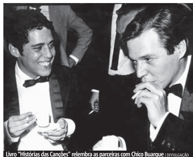
Livro "Histórias das Canções" relembra as parcerias com Chico Buarque